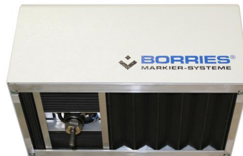
322 mit Faltenbalg